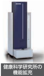
健康科学研究所の機能拡充