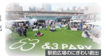
駅前広場のにぎわい創出