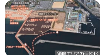
須磨エリアの活性化