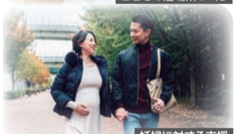
妊婦に対する支援