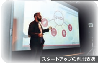
スタートアップの創出支援