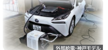
外部給電・神戸モデル