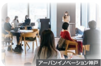
アーバンイノベーション神戸