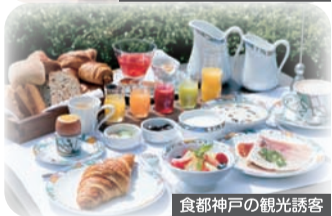
食都神戸の観光誘客