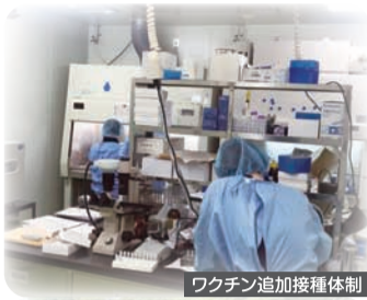
ワクチン追加接種体制