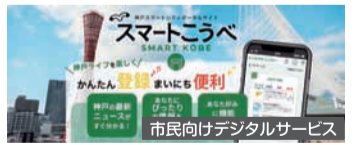
市民向けデジタルサービス